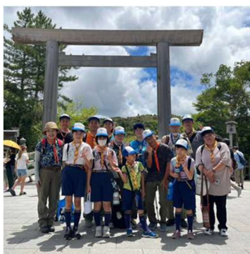
(伊勢神宮・宇治橋まえにて)

8月5日(土)～7日(月)に、北は北海道から南は鹿児島まで、神社スカウト58団、総勢1000人のボーイスカウト・ガールスカウトが伊勢神宮に集結し、第13回神社スカウト全国大会が開催されました。栗東第8団も初めて参加し、15名のスカウトと指導者が参加しました。最終日には、「もくもく手作りファーム」に立ち寄り、ポイルウイナー作りを体験しました。