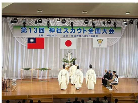
(開会式の様子 皇学館大学記念講堂にて)