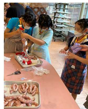
(ポイルウイナー作り)